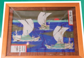
寿都に残る北前船の遺産 寿都神社の船絵馬