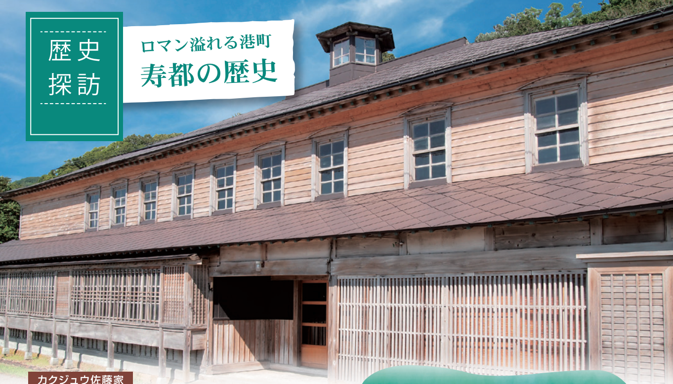
カクジュウ佐藤家