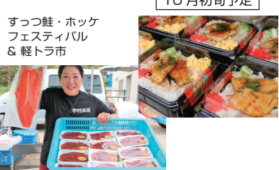
すつっ鮭・ホッケフェスティバル & 軽トラ市 10月初旬予定