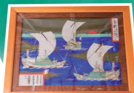
寿都に残る北前船の遺産 寿都神社の船絵馬