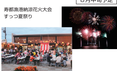
寿都漁港納涼花火大会 すつっ夏祭り 8月中旬予定