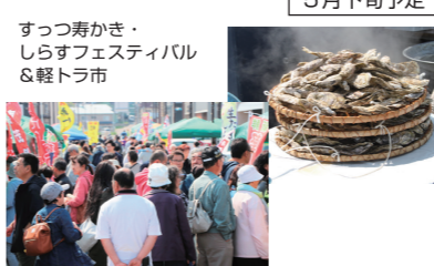
すつっ寿かき・しらすフェスティバル & 軽トラ市 5月下旬予定