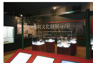
寿都町文化財展示室

所在地：寿都郡寿都町字歌楽町有戸14 見学方法：事前にご連絡ください。 お問合せ：寿都町教育委員会 (TEL 0136-62-2100)