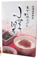
(有)ヤマブン栗田水産