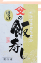
(有)ヤマブン栗田水産