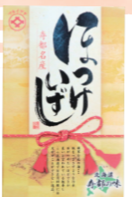
(株)マルイゲタ小坂水産