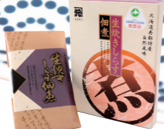
(株)カネゲン本田水産