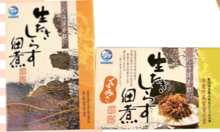
(株)カネキ南波商店

寿都湾で春の1カ月間だけ獲れる「小女子（こうなご）」。魚体が小さく鮮度が落ちやすいので、水揚げしてすぐに加工場へと運ばれ、寿都を代表する名産品「生炊きしらす佃煮」に加工されます。美味しさの決め手は“秘伝の味付け”と長年培われてきた“職人の技術”。100年以上続く伝統の製法で作りに上げられた逸品です。「くるみ入り」や「ごま入り」など種類も豊富。各水産加工会社によって味の違いがあるので、ぜひ食べ比べてみてください。