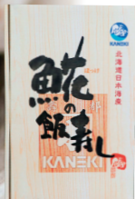
(株)カネキ南波商店

飯寿司（いすし）は、冬の北海道の貴重な保存食として伝わり続ける伝統の郷土料理です。寿都で一番人気の飯寿司は、秋の「ほっけ」を使った「ほっけ飯寿司」。新鮮なほっけを米・こうじ・にんじんなどと一緒に漬け込み、じっくりと熟成させることで、よりコクと旨みが増してきます。米の甘みと乳酸の酸味のバランスが絶妙で、熟成された魚と野菜の旨みがたまらない逸品です。各水産加工会社それぞれ味の特徴があるので、ぜひ好みの味を見つけてください。