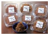
各社食べ比べ佃煮道の駅みなとま〜れ寿都