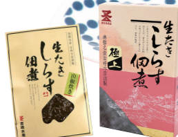
(株)マタウロコ吉崎水産