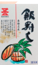
(株)マタウロコ吉崎水産