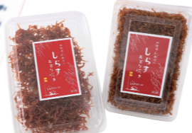
(有)マルトシ吉野商店