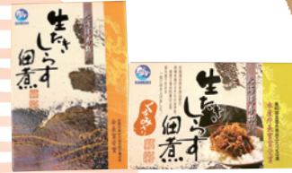
(株)カネキ南波商店

寿都湾で春の1カ月間だけ獲れる「小女子（こうなご）」魚体が小さく鮮度が落ちやすいので、水揚げしてすぐに加工場へと運ばれ、寿都を代表する名産品「生炊きしらす佃煮」に加工されます。美味しさの決め手は「秘伝の味付け」と長年培われてきた「職人の技術」。100年以上続く伝統の製法で作りに上げられた逸品です。「くるみ入り」や「ごま入り」など種類も豊富。各水産加工会社によって味の違いがあるので、ぜひ食べ比べてみてください。