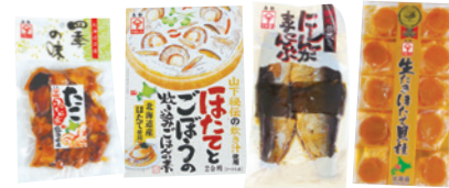
MAP 1 (株)山下水産

寿都湾は四季を通じて多種多彩な魚介類が水揚げされる海産物の宝庫。新鮮な魚介は伝統を継承する職人たちの技術によって絶品の水産加工品へと姿を変えます。寿都町では老舗水産加工会社が9社あります。時代を超えてその味を守り続けている寿都の職人たちが生み出す伝統の味をぜひご賞味ください。