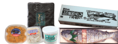
MAP 8 (株)マタウロコ吉崎水産