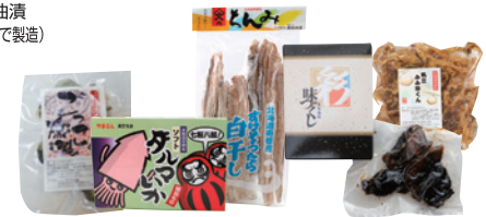
MAP 5 (有)ヤマブン栗田水産