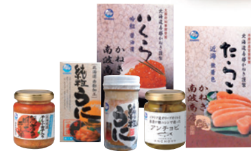
MAP 2 (株)カネキ南波商店

所 寿都郡寿都町字歌楽町美谷206-1 休 不定休 ※要問合せ TEL 0136-64-5018 ※直売店有 9:00~16:00