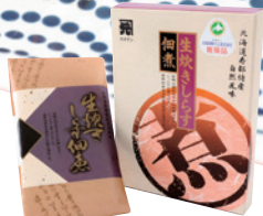
(株)カネゲン本田水産