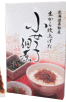
(有)ヤマブン栗田水産