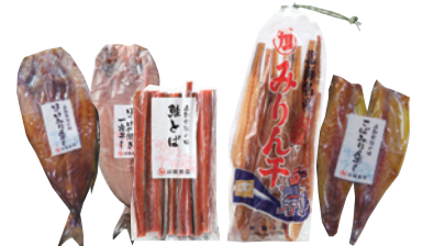
MAP 6 マルカ加藤商店