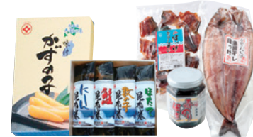
MAP 3 (株)マルイゲタ小坂水産

所 寿都郡寿都町字大磯町75 休 1~4月、6~7月は土日定休 TEL 0136-62-2023 ※直売店有/8:30~17:00