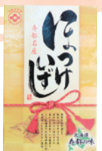
(株)マルイゲタ小坂水産