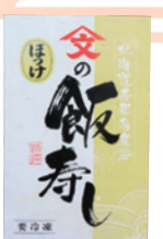
(有)ヤマブン栗田水産