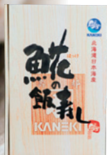
(株)カネキ南波商店

飯寿し（いすし）は、冬の北海道の貴重な保存食として伝わり続ける伝統の郷土料理です。寿都で一番人気の飯寿しは、秋の「ほっけ」を使った「ほっけ飯寿し」。新鮮なほっけを米・こうじ・にんじんなどと一緒に漬け込み、じっくりと熟成させることで、よりコクと旨みが増してきます。米の甘みと乳酸の酸味のバランスが絶妙で、熟成された魚と野菜の旨みがたまらない逸品です。各水産加工会社それぞれ味の特徴があるので、ぜひ好みの味を見つけてください。