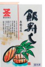
(株)マタウロコ吉崎水産