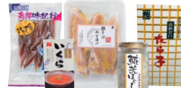
MAP 4 (株)カネゲン本田水産

所 寿都郡寿都町字大磯町109 休 日曜(不定休あり)、1~4月は土日定休 TEL 0136-62-2611 ※直売店(北の旬鮮工房)/9:00~17:00