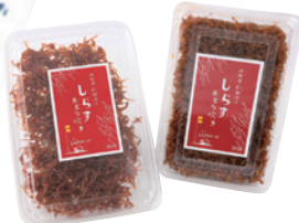
(有)マルトシ吉野商店