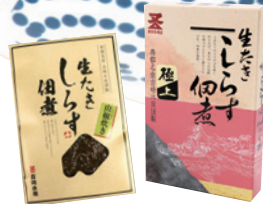
(株)マタウロコ吉崎水産