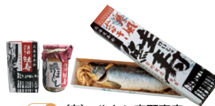
MAP 7 (有)マルトシ吉野商店

所 寿都郡寿都町字大磯町187 休 日曜日(不定休あり) 1~4月は土日定休 TEL 0136-62-2080