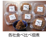
各社食べ比べ佃煮道の駅みなとま〜れ寿都